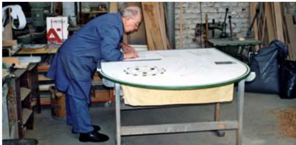
Handarbeit bei der Gestaltung der Frontplatte