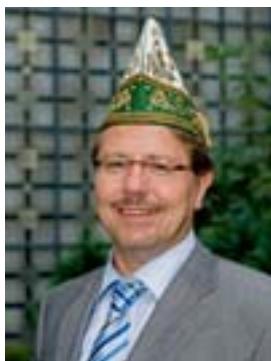
Präsident Lothar Weiland