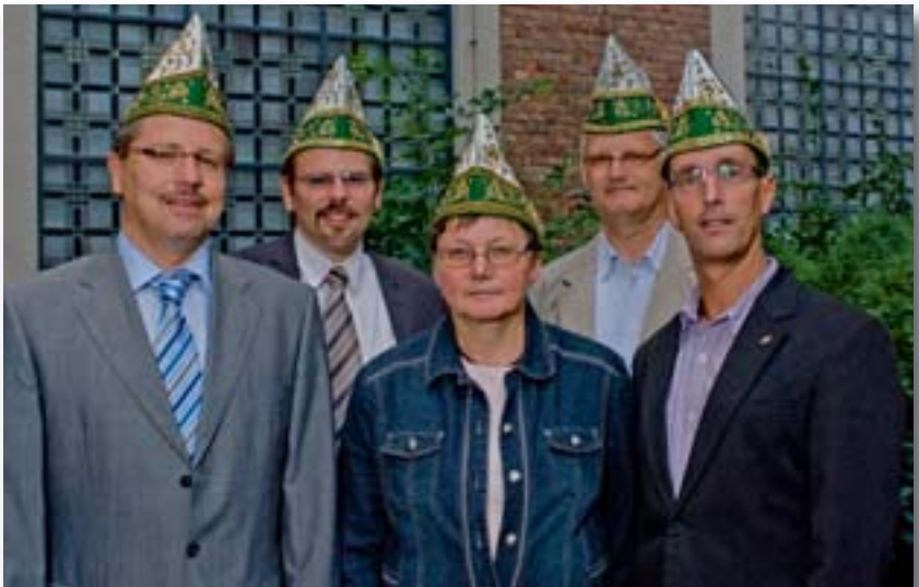
Vorstand Fastelovendsfründe St. Mechtern 2010