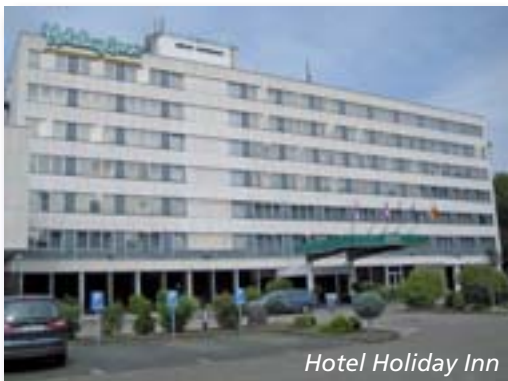
Hotel Holiday Inn

Im Jahr 2006 mussten wir schweren Herzens unseren bisherigen Veranstaltungsort in der Pfarre, das Ehrenfelder Kolpinghaus, verlassen und verlegten unsere Sitzung wie die anderen bisher dort feiernden Karnevalsvereine in das Hotel Holiday Inn am Stadtwald im benachbarten Stadtteil Lindenthal. Nach nunmehr 5 Sitzungen in dem neuen Rahmen haben wir uns dort sehr gut eingelebt. Erstklassiger Service, zivile Preise und die Gelegenheit, auf günstige Übernachtungsmöglichkeiten zurückzu greifen, haben uns dort schnell heimisch werden lassen.