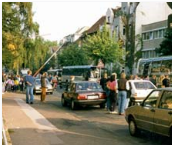
Katholische Grundschule „Vincenz Statz“, Lindenbornstraße