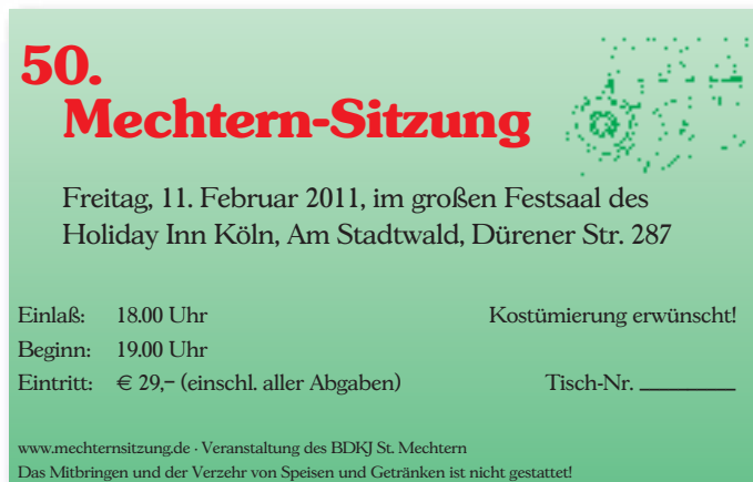
Eintrittskarte Mechternsitzung 2011