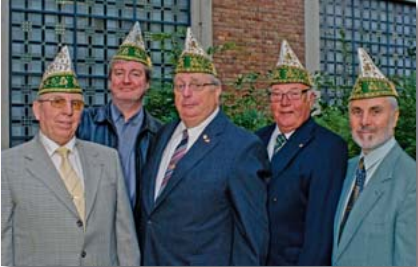
Vorstand von 1968