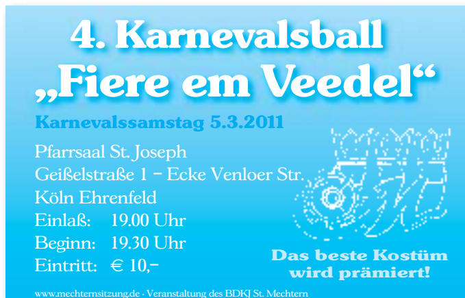
Eintrittskarte Ball 2011

gramm unserer Jubiläumssitzung am 11. Februar 2011 schon rund 14.000 ausgegeben werden. Der Eintrittspreis stieg in dieser Zeit von 3,50 DM auf 29,00 in 2011. Das Publikum unserer Sitzungen ist bei Karnevalisten sehr beliebt, da Rednerbeiträge auch zu später Stunde noch aufmerksam aufgenommen werden, was in Kölner Sälen nicht selbstverständlich ist.