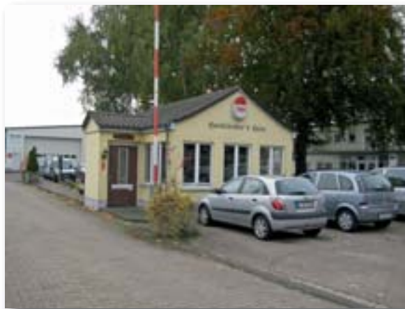
Hackländer's Hein, Elferratstreffpunkt