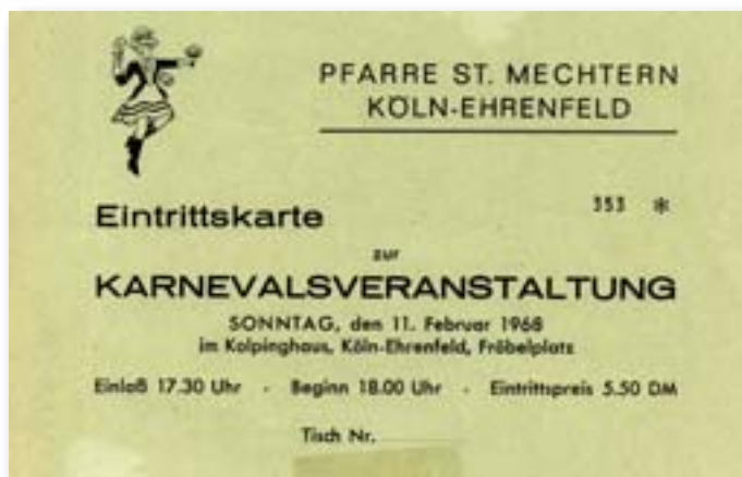
Eintrittskarte Mechternsitzung 1968